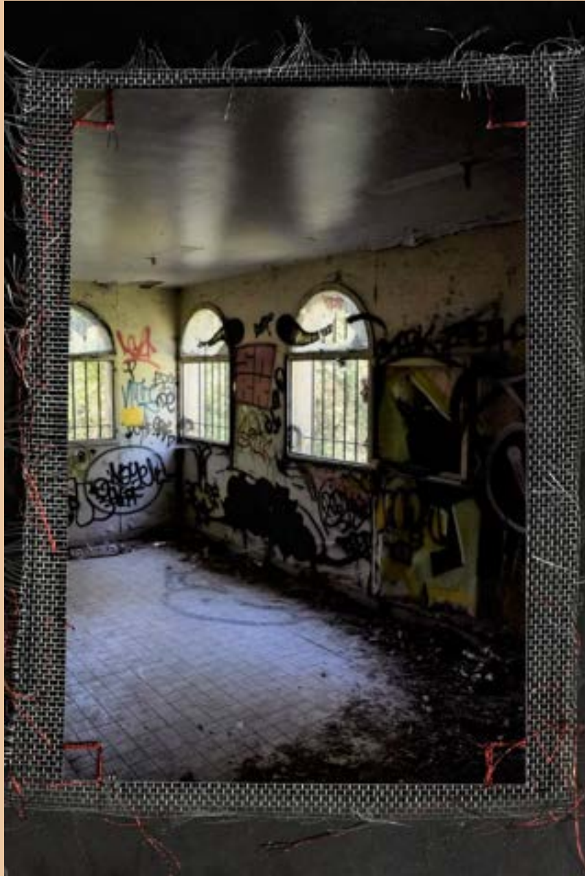
Naissains - Née Sainte - Nez seins ?

PRENDRE LE PLUS BEAU, NE LE MONTRER QU'A UN PUBLIC PATIENT ET CURIEUX