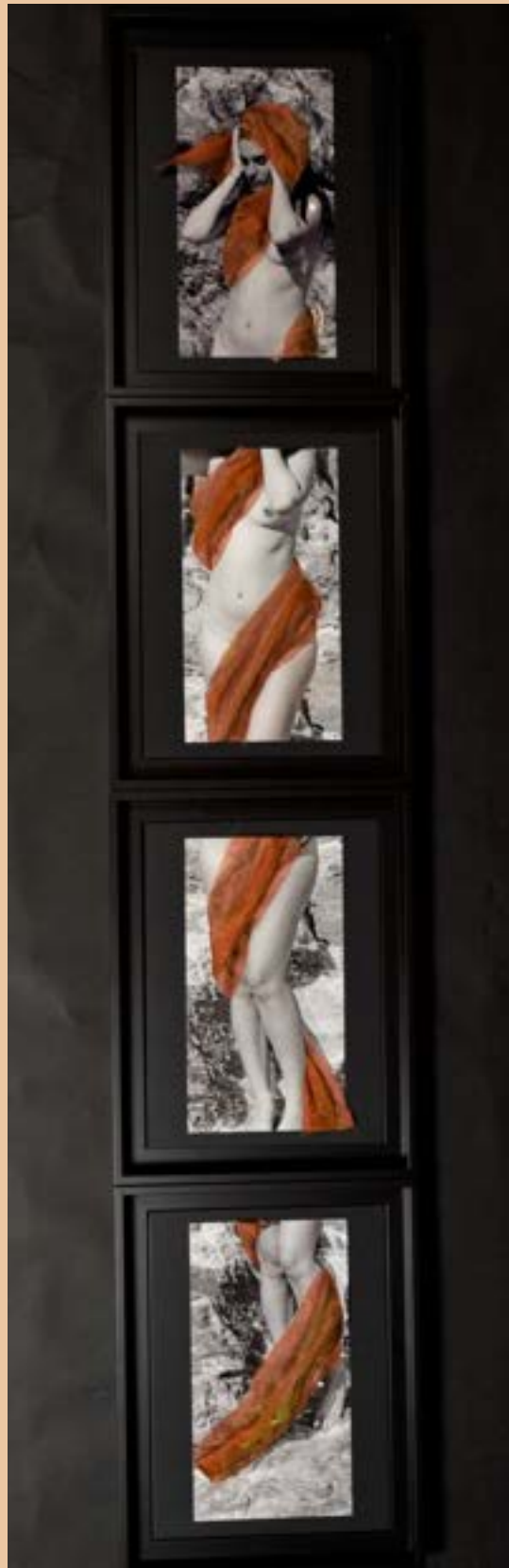
Photos taille 31 * 16 cm, avec rehausses en voile, dans 4 caisses américaines taille chacune 40 * 31 cm