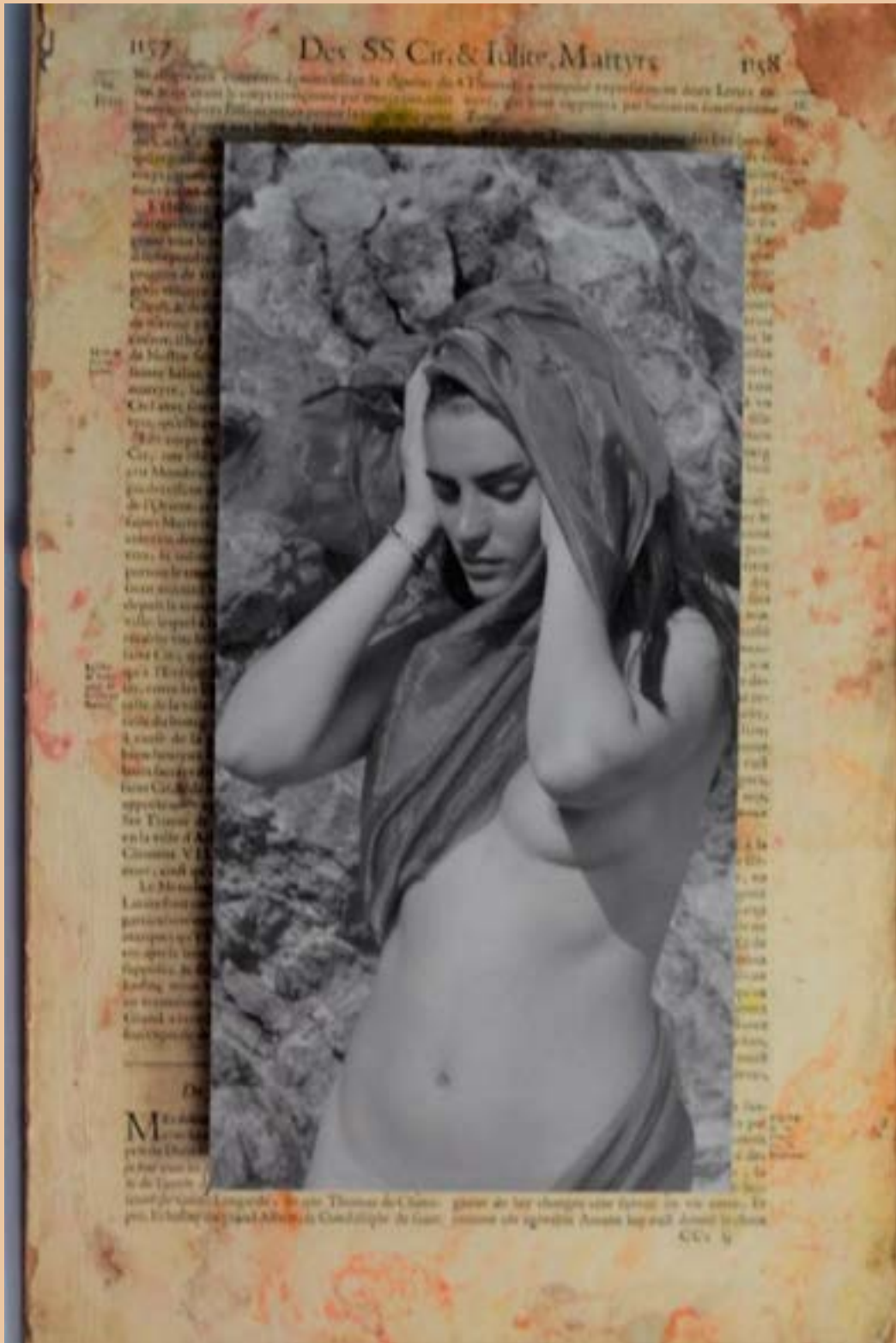
Photos taille 30 * 15 cm, collées sur vieux papiers ecclésiastiques et planches de bois dimension 40.5 * 25.5 cm