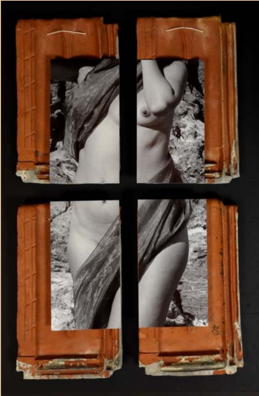
4 photos taille 31 * 17 cm, sur Dibond et quatre tuiles véritables dimensions chacune 42 * 25 cm