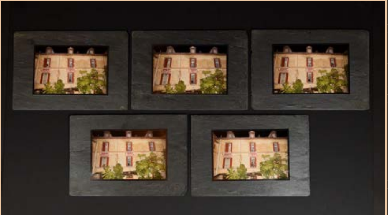
Photos taille 21 * 14 cm collées sur cinq ardoises véritables dimension 32 * 22 cm