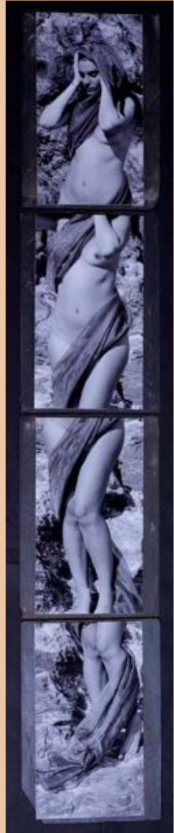
Photos taille 30 * 15 cm, collées sur vieux papiers ecclésiastiques et planches de bois dimension 40.5 * 25.5 cm, dans véritables caisses américaines ou véritables ardoises