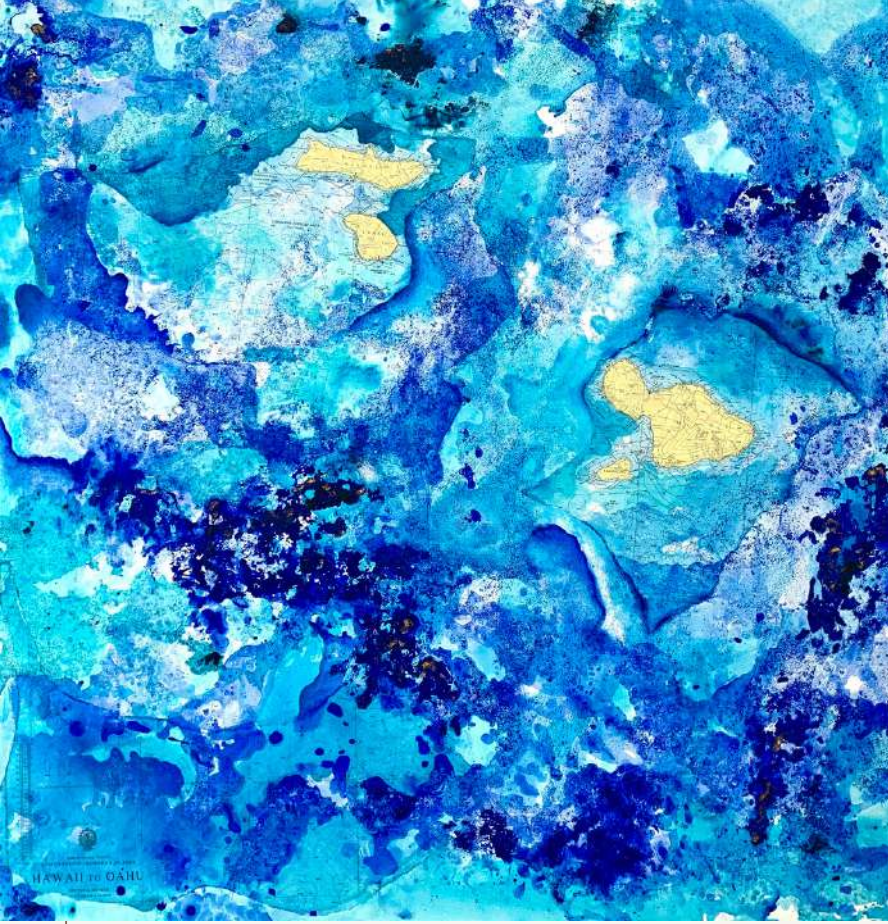
FRAGMENTS INSULAIRES Acrylique et marouflage sur toile 100 x 100 cm